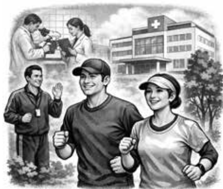
がん再発予防の運動綴法