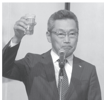
廣澤健青年経営者協会代表

原材料費、人件費に対する販売価格への転嫁状況 「価格の引き上げ(転嫁)」に成功した」28・8%、「価格引き上げの交渉中」24・8%、「これから価格引き上げの交渉を行う」15・0%でした。