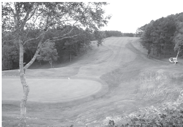
しらかばコース9番ホール

コースは、大自然に包まれた全27ホールで、標高200mから280mの丘陵地にある。フェアウェイは広く、ダイナミックで、モミ、カラマツ、シラカバ、ダテカンバなど豊富な樹木で各ホールが仕切られ、フェアウェイは前後左右に様々なアンジュレーションがあつて変化に富み、スコアを伸ばすには高度な戦略が要求される。