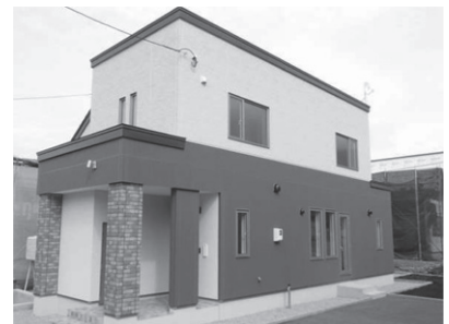
現在主流となってきた「外断熱」住宅。基礎工事も従来の「内断熱」とは異なる

発足当時は高度成長期で、札幌市内を中心に全道主要都市の宅地整備事業と「建売住宅」の販売がメインだった。その後、マンションの建設にも進出するが、オイルショックやバブル崩壊など、経済環境の激変や、少子高齢化などの社会環