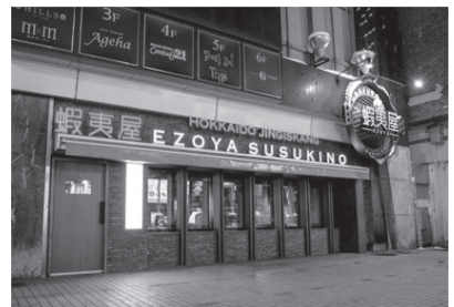
北海道ジンギスカン蝦夷屋(中央区南5西3北専ビル1階、電話011・513・0677)

「特製の辛味ネギ」をのせて食べるのがお勧め。もちろん、定番の丸い「ラムロール」もあるので心配無用だ。さらに、肉と一緒に食べる専用ごはんの「オン・ザ・ライス」は一度食べるとクセになる。北海道産の味の濃い生卵と、きざみネギなどがのっけていて、これに特性タレと合わせた道産山わさびと、好みの加減に焼いた肉をのせて豪快に食べてほしい。さらに、朗報がある。同グル