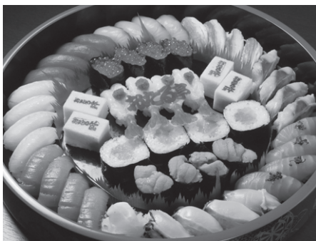
テイクアウト&デリバリーのおたる亭の寿司

そんな中、社員らの発案で始めたのが「テイクアウト&デリバリー」だった。寿司や、焼き鳥などの居酒屋メニューから始め、オードブルやピザなども広げ、物販にも力を入れた。今後、専門店としての事業化が可能なほど成功させた