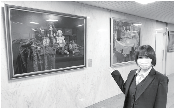
北海道通信ビル1階ロビー、左は山中雅彦作「人形のある構図」

絵画は購入したものや、 作家から展示用に提供を 受けたもので、画家の略 歴など、分かりやすい解 説付きの銘板が付いてい る。