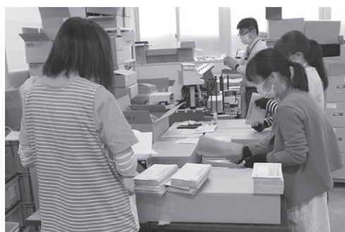
専用スペースで封筒の仕分け作業を行なう

バブル崩壊後は、道内の広告代理店が次々と姿を消し、同社も影響を受けたが社員一丸となつて何とか乗り切った。