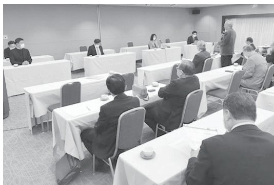
冒頭に挨拶する峰崎会長(右奥)

今後は、①代表者の選出方法②協議会からの情報発信の内容と事務局体制について③予算と分担金などについて協議を続けることになり、新年度からの移行を目指しています。