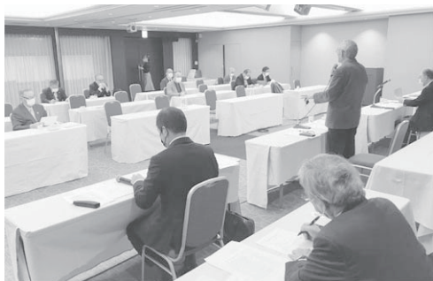
道商工連・同協同組合理事会で挨拶する峰崎会長

新たな協議会の機能は、①情報交換はNET通信の充実やホームページの活用②研修(次ページへ続く)