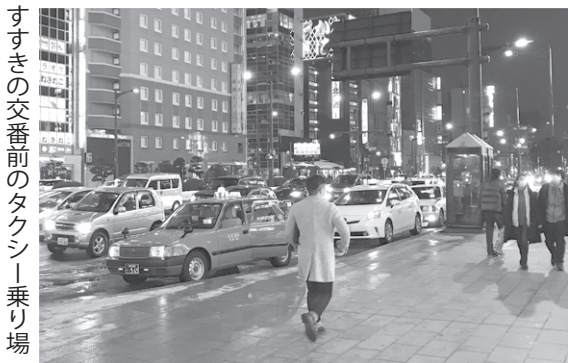
すすきの交番前のタクシ乗り場